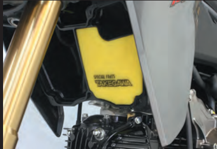
パワーフィルター装着 (エアクリーナーボックスのカバーを外しています)