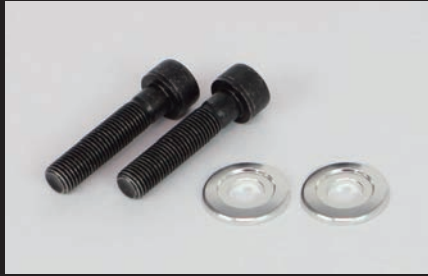
プレーンタイプ/シルバー

■別売のアルミ削り出しリアクッションマウントナット(06-06-0033~0040)でマウント部上下のデザインを揃える事ができます。*マフラーマウント部は除く