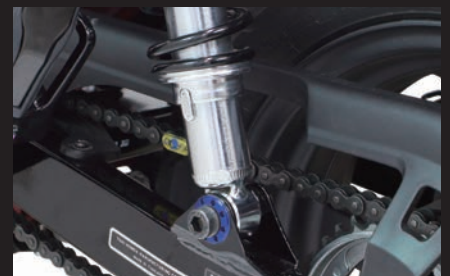
装着(8ホールタイプ/ブルー)