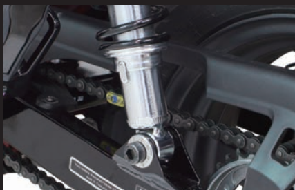
装着(8ホールタイプ/シルバー)