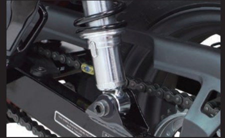
装着(プレーンタイプ/ブラック)