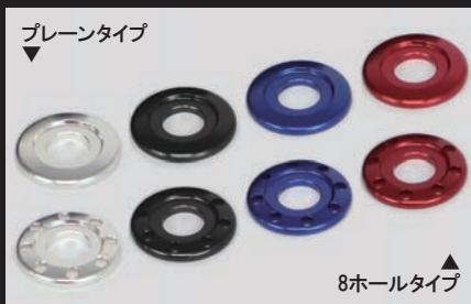
カラーラインナップ