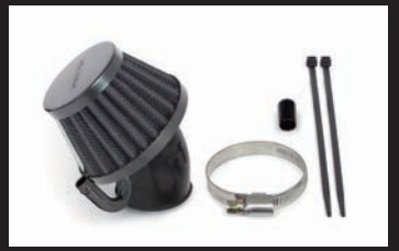
エアフィルターキット