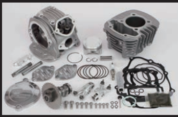
スーパーヘッド4V+Rボアアップキット145cc

※ノーマルエアクリナーへ接続されているコネクティングチューブを取外す必要があります。※エアクリナーケースは、エアクリナーガーニッシュを固定する為、取外さず残す必要があります。