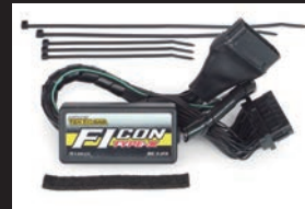
FIコンTYPE-X(インジェクションコントローラー)