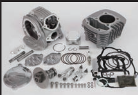
スーパーヘッド4V+Rボアアップキット145cc