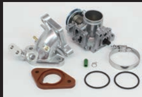
ビッグスロットルボディークイット Φ28