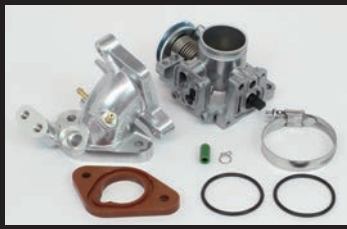
ビッグスロットルボディークット Φ28