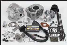
スーパーヘッド4V+Rコンボキット145cc

吸入効率を高め、ノーマルエンジン、カスタムエンジンのどちらのエンジン仕様であっても出力性能が向上します。純正エアクリナーボックスに繋がるコネクティングチューブを取外し、スロットルボディークイに直接装着します。エアフィルター本体にはブローバイユニオンがついている為、ブローバイホースに接続できます。エアフィルターはブラックエレメントとレッドエレメントの2種類。 本製品はエンジン周辺にコンパクトに収めることができ、車両のシルエットを崩すことなく、取付け出来ます。 ※オフロード走行を行うことは出来ません。 ※カスタムエンジン車(カムシャフト/ボアアップ)、又はSP武川製各種マフラーを本製品と同時装着する場合、FIコンTYPE-X(インジェクションコントローラー)の同時装着が必要になります。 ※ノーマルエアクリナーへ接続されているコネクティングチューブを取外す必要があります。※エアクリナーケースは、エアクリナーガーニッシュを固定する為、取外さず残す必要があります。