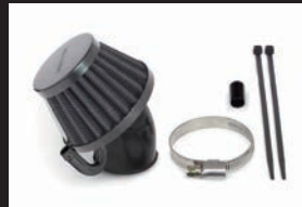
エアフィルターキット