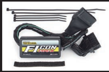
FIコンTYPE-X(インジェクションコントローラー)