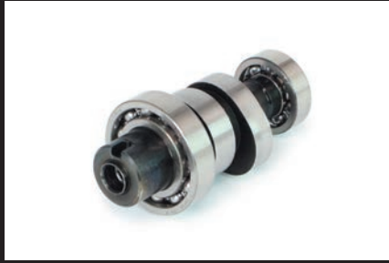
スポーツカムシャフト