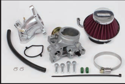
ビッグスロットルボディーキット Φ34

※本製品を装着する場合、必ずFIコン TYPE-e(インジェクションコントローラー)の同時装着が必要になります。SP武川製エンジンパーツに合わせ、セッティングしたデータを複数内蔵しておりますのでエンジン仕様に合わせてパソコン又はスマートフォンを用いて手軽にセッティングデータの選択、変更、修正を行います。SP武川製FIコン TYPE-eに内蔵されたMAP以外のエンジン仕様の場合、内蔵MAPデータを元に、再セッティングを行う必要があります。予めご了承ください。