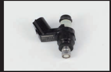
フューエルインジェクター(G-1)