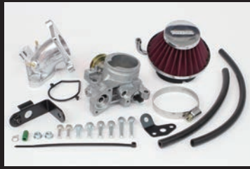
ビッグスロットルボディーキット

※本製品を装着する場合、必ずFIコン TYPE-X(インジェクションコントローラー)、の同時装着が必要になります。SP武川製エンジンパーツに合わせ、セッティングしたデータを複数内蔵しておりますのでエンジン仕様に合わせてパソコン又はスマートフォンを用いて手軽にセッティングデータの選択、変更、修正を行います。FIコン TYPE-Xは、EASYモードとEXPERTモードの2種類からお選びいただけます。ノーマルシリンダーヘッド仕様の内蔵MAPは、EASYモードに数多く内蔵されております。又、SP武川製FIコン TYPE-Xに内蔵されたMAP以外のエンジン仕様の場合、内蔵MAPデータを元に、再セッティングを行う必要があります。予めご了承ください。