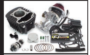
ハイパーSステージキット145cc