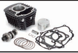
Sステージキット145cc(カムシャフト付属)

■ハイパーSステージボアアップキットは、SステージボアアップキットにFicon TYPE-e(インジェクションコントローラー)、ビッグスロットルボディキット、大容量インジェクターが付属しています。