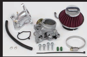
ビッグスロットルボディークット Φ34