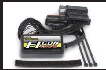
FIコンTYPE-e(インジェクションコントローラー)