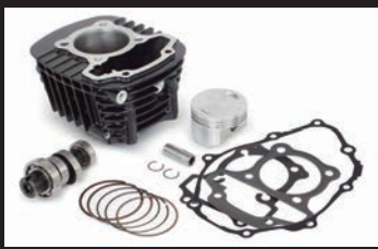
Sステージキット145cc(カムシャフト付属)

Sステージボアアップキット145cc、スポーツカムシャフト、FIコンTYPE-e(インジェクションコントローラー)、ビッグスロットルボディークットを装着した場合、増大する吸入空気量に対して純正のフューエルインジェクターでは、燃料噴射量が不足する為、この大容量インジェクターの同時装着が必要になります。 ※Sステージ145cc(カムシャフト無し)の仕様でSP武川製マフラーを装着する場合、大容量インジェクターは必要ありません。