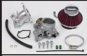
ビッグスロットルボディキット Φ34