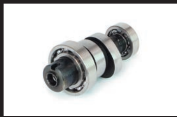
スポーツカムシャフト(N-10)