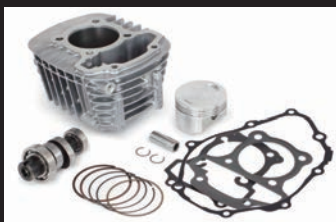
Sステージキット145cc(カムシャフト付属)

本製品は、SP武川製エンジンパーツ用に開発されたSP武川オリジナルの“ビッグスロットルボディークिट”です。エンジン周辺にコンパクトに収めることができ、車両のシルエットを崩すことなく、取付けできます。又、カウルや配線の加工は一切必要無く、取り付けできます。吸入効率に優れたエアフィルターが付属 ※ノーマル車両には使用できません。 Φ34mmのビッグスロットルボディークिटを採用することで、SP武川製エンジンパーツの性能を最大限に引出し、出力アップが可能になります。