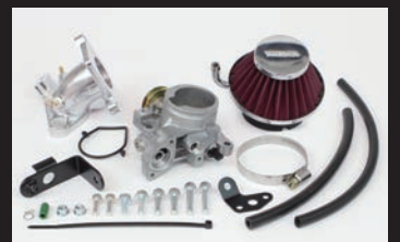
ビッグスロットルボディークिट Φ34