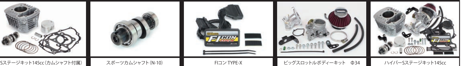
Sステージキット145cc(カムシャフト付属) スポーツカムシャフト(N-10) FコンTYPE-X ビッグスロットルボディーキット Φ34 ハイパーSステージキット145cc

■ハイパーSステージボアアップキットは、SステージボアアップキットにFコンTYPE-X(インジェクションコントローラー)、ビッグスロットルボディーキット、大容量インジェクターが付属しています。