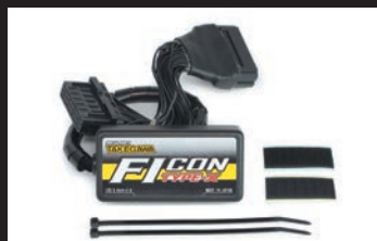
FCON TYPE-X(インジェクションコントローラー)