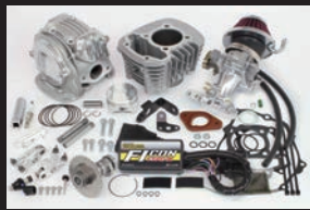
スーパーヘッド4V+Rコンボキット145cc