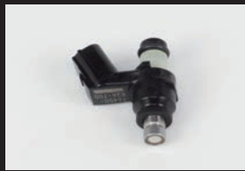
フューエルインジェクター(G-1)