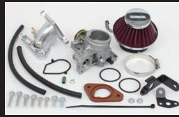
ビッグスロットルボディークイーク Φ34