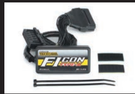
Ficon TYPE-X(インジェクションコントローラー)