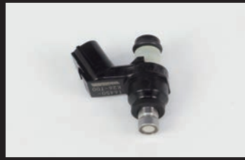
フューエルインジェクター(G-1)