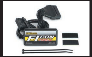
FIコンTYPE-X(インジェクションコントローラー)