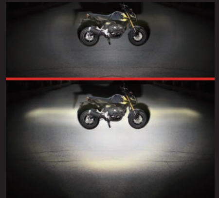
ノーマルヘッドライトにフォグランプ2灯有無の比較 上:無し/下:有り(2灯)