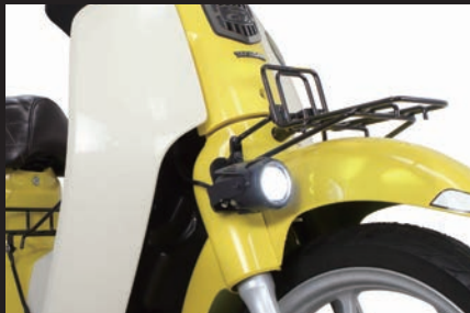
純正フロントキャリアの同時装着写真(点灯)