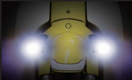
05-08-0653 (2灯仕様) 装着写真(点灯)