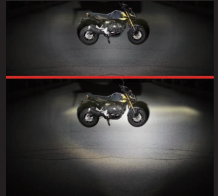
ノーマルヘッドライトにフォグランプ1灯有無の比較 上:無し/下:有り(1灯乗車時右装着)