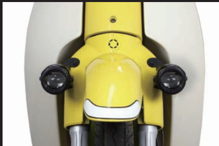
05-08-0653 (2灯仕様) 装着写真