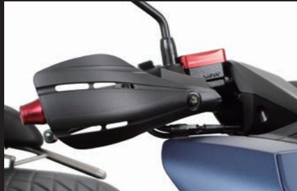
装着(マットブラック)