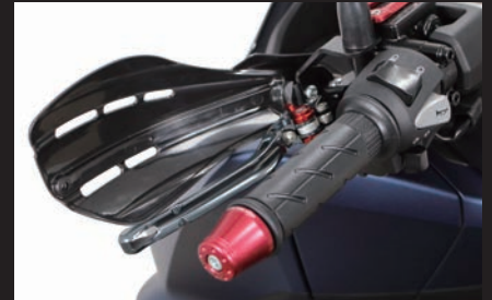
装着(マットブラック)