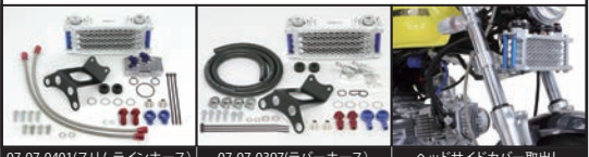
07-07-0401(スリムラインホース) 07-07-0397(ラバーホース) ヘッドサイドカバー取出し ■適合フレームNO. Z50J-1600008～/AB27-1000001～1899999

コンパクトクールにはオイルクーラープレート、ガードが標準装備されています。 オイルクーラーホースはラバーホースとスリムラインホースとブレードホース#4の3種類。