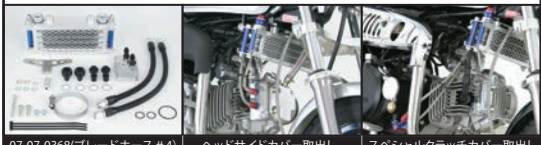
07-07-0368(ブレードホース#4) ヘッドサイドカバー取出し スペシャルクラッチカバー取出し ■適合フレームNO. Z50J-1600008～/AB27-1000001～1899999

コンパクトクールにはオイルクーラープレート、ガードが標準装備されています。 オイルクーラーホースはラバーホースとスリムラインホースとブレードホース#4の3種類。