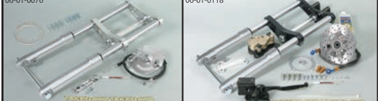
■適合フレームNO. Z50J-1300017～/AB27-1000001～1899999 ※詳細はWEB SITE参照 06-01-0076 06-01-0118

路面からの衝撃吸収と共に路面の追従性を高め、安定した走行をお楽しみ頂けるフロントフォークキットです。ドラムブレーキ用はブレーキパネとブレーキアームが付属。 ディスクハブは軽量ダイカスト製を採用 トップブリッジ、ステアリングシステムは、大排気量スタンダードスタイルの40mmオフセット。 別途購入部品:ヘッドライトステー・ウインカーステー・スロットルハウジング又はハイスロットルが必要。モンキーの方でバーハンドルを選択される場合、ハンドルの変更が必要。 ■ノーマル・弊社製8インチアルミホイール(2.5J/※3.5J)対応 ※弊社製8インチホイール(3.5J)はフロントドラムブレーキのみ対応 ※3.5Jはフロントディスクブレーキには取付不可