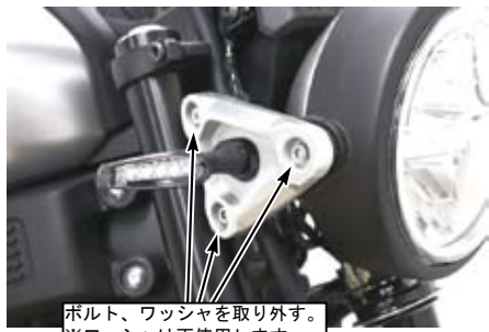
ボルト、ワッシャを取り外す。 ※ワッシャは再使用します。