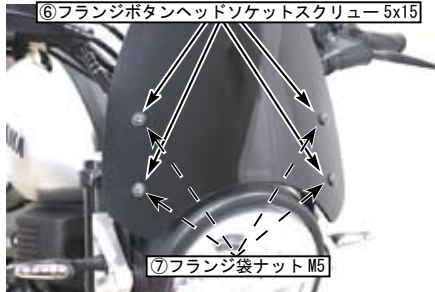
⑥フランジボタンヘッドソケットスクリュー5x15