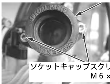
ソケットキャップスクリュー M6×15