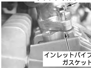
インレットパイプ ガスケット