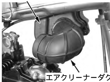
エアクリーナーダクト