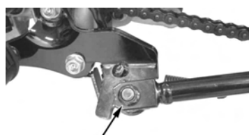
サイドスタンドナット