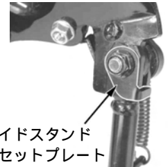
サイドスタンド セットプレート